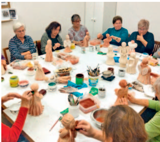
Společné tvoření žen v S-klubu.

A to nejlepší na závěr roku. Právě probíhá dokončování skupiny sošek, kterým říkáme pracovní „sbor andělů“. V průběhu tvoření se do S-klubu přidaly další členky, a tak vzniklo více než patnáct figur, které jsou ná-