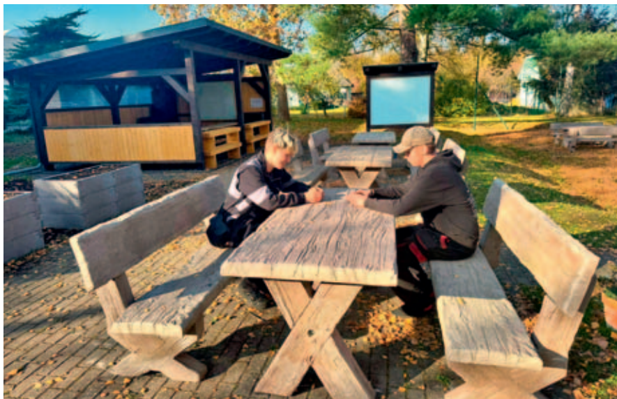
Technická škola se může pochlubit novými venkovními učebnami.

Střední technická škola ve Vysokém Mýtě s hrdostí oznamuje dokončení nové venkovní učebny, která vznikla přímo v areálu školy.