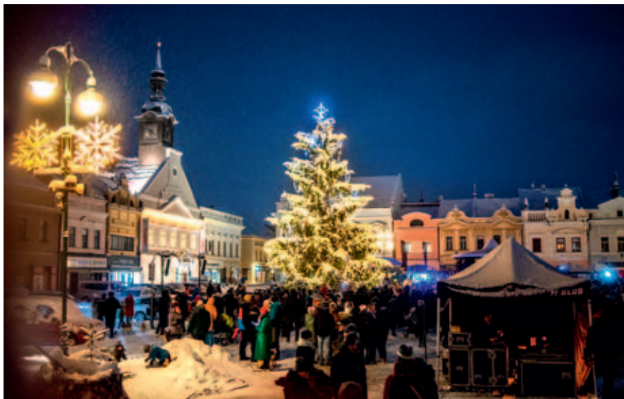
Rozsvícení vánočního stromu na náměstí.

Přijďte nasát tajemnou atmosféru adventu a blížících se Vánoc na vysokomýtské náměstí, kde se uskuteční tradiční kujebácké jarmarky.