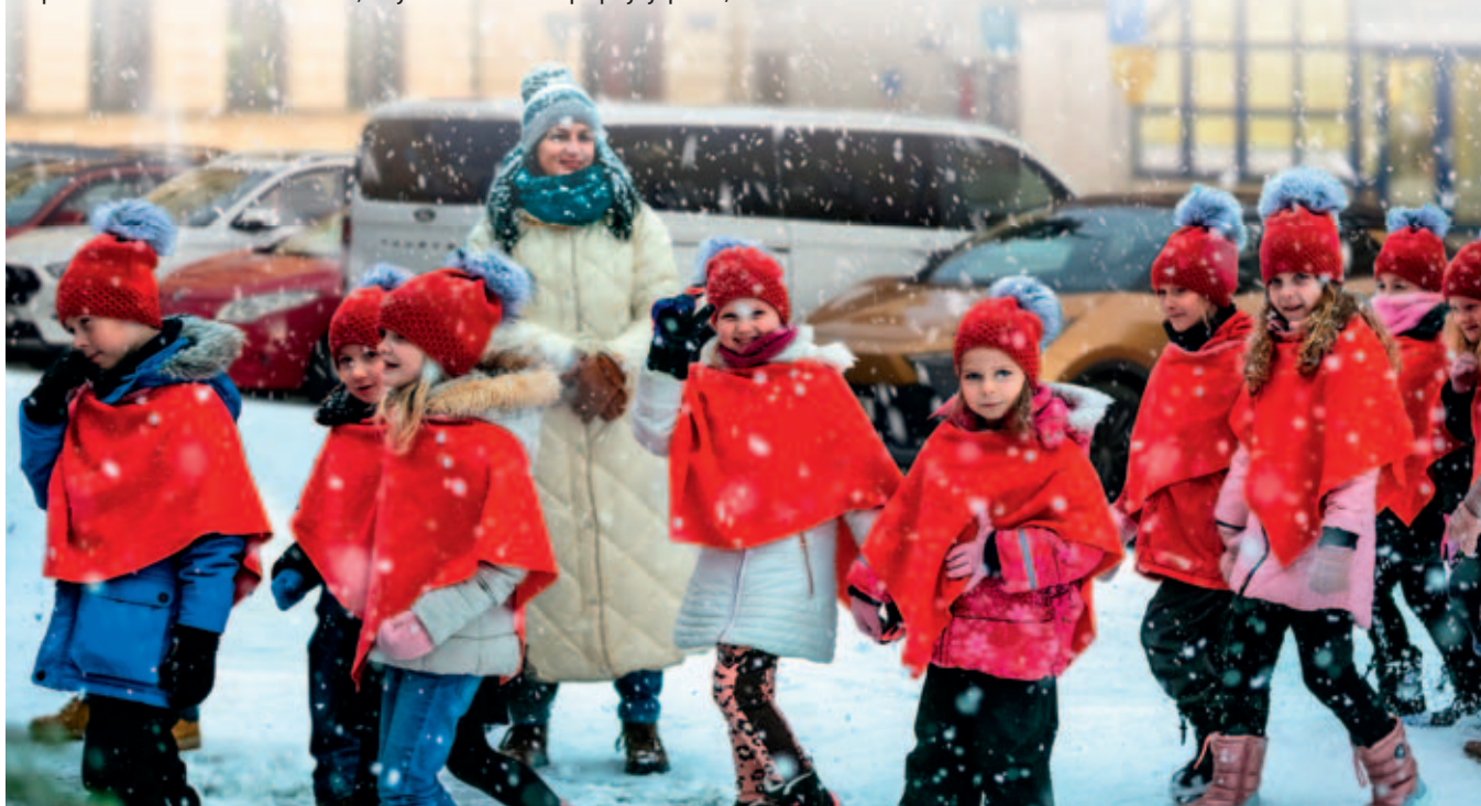
Děti ze sboru Korálek přicházejí na pódium za nelehkým úkolem, rozsvítit svým zpěvem vánoční strom.

Za redakci Vysokomýtského zpravodaje Dagmar Sekaninová, šéfredaktorka