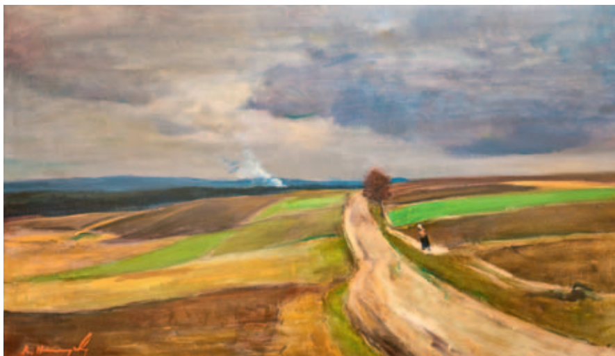
Rudolf Hanych, Polní cesta, olej na plátně.

Prošli Vysokým Mýtem, tak se jmenuje poslední letošní výstava, která prezentuje obrazy a sochy známých autorů, kteří své tvůrčí období neprožili ve Vysokém Mýtě, ale přesto sem přijížděli. Někteří za přáteli, jiní za příbuznými, další, aby se zde léčili... Většinou se o jejich návštěvách neví, nedočtete se o nich v jejich životopisech. Možná budete překvapeni, kdo všechno naším městem prošel.