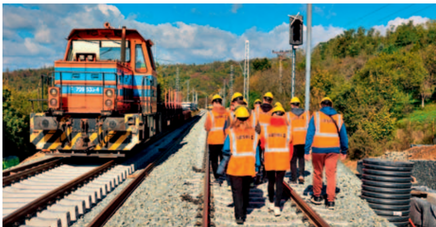
Prohlídka modernizace železnice.

Studenti dopravního stavitelství absolvovali 15. října odbornou exkurzi na modernizaci železničního svršku v oblasti Střelice, kde viděli rekonstrukci kolejí a pracovní stroje na pokládku pražců i kolejnicových pásů. Druhá část exkurze proběhla u Svitav, kde studenti zkoumali zemní těleso dálnice, usazovací nádrž, odlučovací zařízení a zaji-