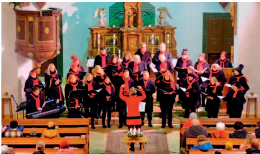
Pěvecký sbor Otakar před Vánoci chystá několik koncertů.

Pěvecký sbor OTAKAR Vysoké Mýto srdečně zve na své koncerty v adventním čase. Přijďte si poslechnout skladby, které pohladí vaši duši i uši a naladí vás na vánoční atmosféru. Zazní jak tradiční Česká mše vánoční (Rybovka), tak i pásmo rozmanitých skladeb za doprovodu nástrojů.