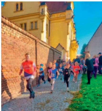
28. říjen se oslavoval během.

Slunečné počasí letos přilákalo rekordní počet sportovních nadšenců, kteří se rozhodli oslavit vznik republiky pohybem