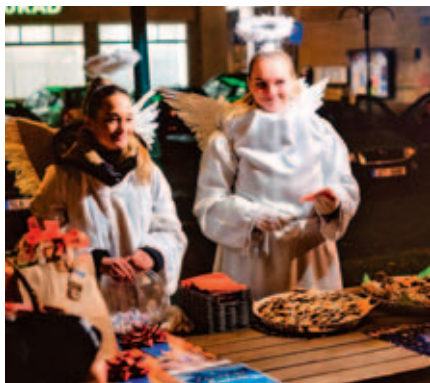
Každoroční zpívání koled na náměstí je doprovázeno andělským obdarováním.

Přijďte se naladit na vánoční atmosféru a společně si zazpívat nejnámější české koledy.