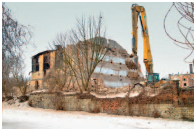
Demolice objektu chladného hospodářství. V pozadí část sladovny, foto Martin Štěpán, 2010, sbírka RMVM.