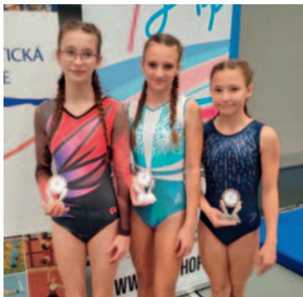
Gymnastky na mistrovství.

Ve dnech 26. – 28. října se uskutečnilo MČR ve sportovní gymnastice žen kategorie C.