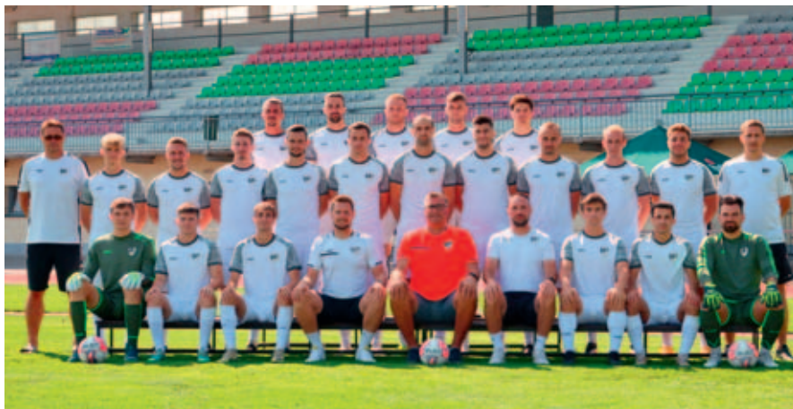
Fotbalový tým A.

Vysokomýtský fotbalový oddíl, jehož základna čítá přes 300 členů, pokračuje v dlouholeté sportovní činnosti, když celkem 11 týmů od nejmenších až po dospělé reprezentuje klub ve svých soutěžích. Podzimní část sezony 2024/2025, která skončila v průběhu listopadu posledními odehranými koly, můžeme hodnotit jako úspěšnou.