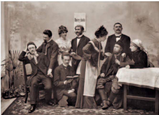
Představení Směry života.