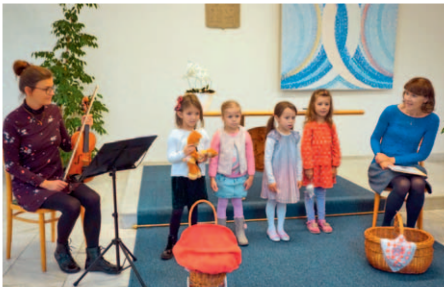
Další vítání nových občánků se uskuteční 25. ledna, rodiče mohou posílat přihlášky svých dětí do 11. ledna.

Město Vysoké Mýto pořádá slavnostní vítání dětí se zápisem do pamětní knihy města. Příští vítání nových občánků se uskuteční v sobotu 25. ledna v dopoledních hodinách v obřadní síni Městského úřadu Vysoké Mýto.