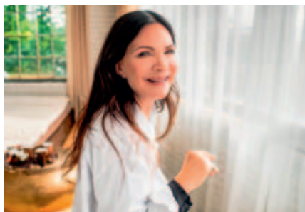
Andělem ověnčená Anna K. vystoupí ve Vysokém Mýtě.

Do povědomí českého publika se uvedla rolí Pacholety ve hře Kytice divadla Semafor Jiřího Suchého již v osmi letech. Její první deska Já nezapomínám měla velký komerční úspěch – prodalo se jí 20 tisíc kusů. V roce 1999 dostala od Akademie Anna