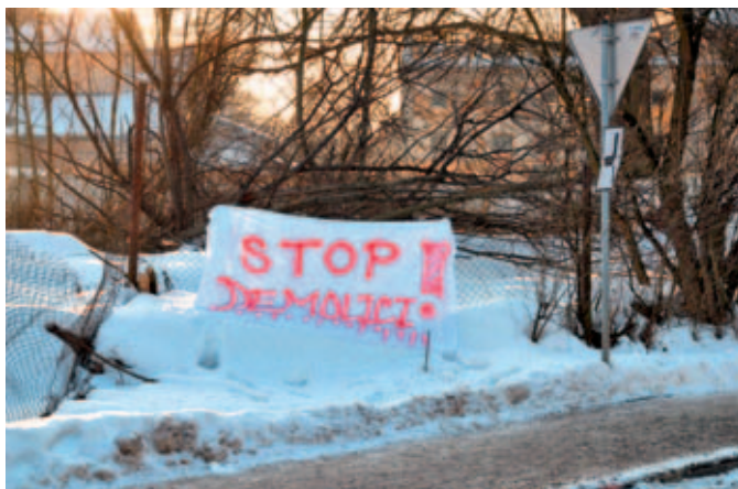
Protestní transparent Občanského sdružení Kujebák umístěný na plotě před pivovarem, foto Martin Štěpán, 2010, sbírka RMVM.