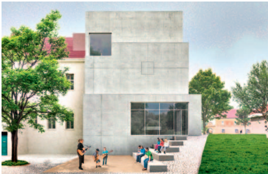
Přístavba ZUŠ Vysoké Mýto.