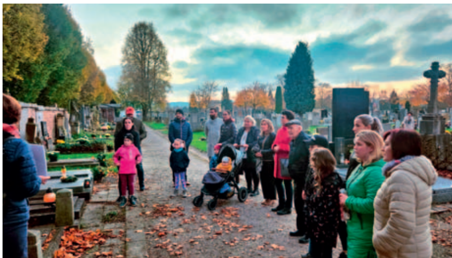
Dušíčková kavárna uctila památku slavných vysokomýtských osobností.

ZŠ Javornického stihla v říjnu a listopadu podniknout spoustu zajímavých akcí.