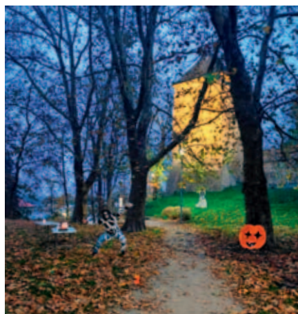
Strašidelnou stezku odvahy podstoupili žáci speciální školy.

Botanická zahrada ve Vysokém Mýtě se v jednu listopadovou středu proměnila v místo plné kouzel, děsivých stínů a strašidelného smíchu. Speciální škola tam pro