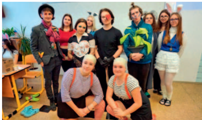
Nevšední den pro své spolužáky připravili studenti SŠ podnikání.