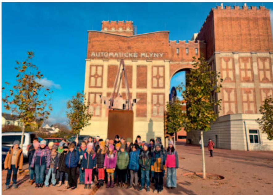
Exkurze do vzdělávacího centra Sféra v areálu Automatických mlýnů.

Během listopadu si žáci naší školy užili mnoho pestrých akcí.