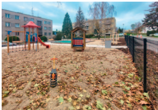
Revitalizace vnitrobloků mezi ulicemi Lidická a Odbojářská.