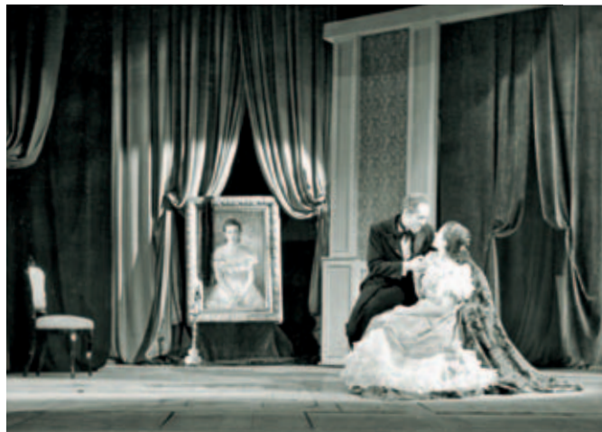
Divadelní představení Maškaráda z roku 1958.