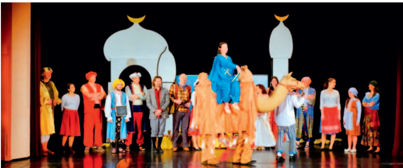
Divadelní zpracování pohádky Lotrando a Zubejda.